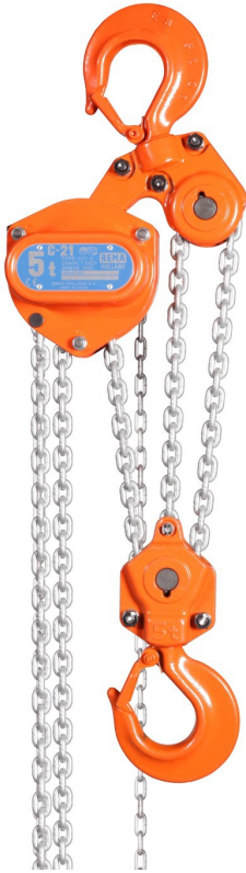
C-21/500 - C-21/2000